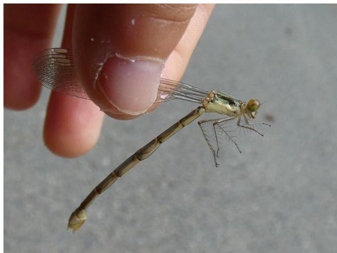
オオアオイトトンボ