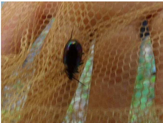
ニジゴミムシダマシの一種