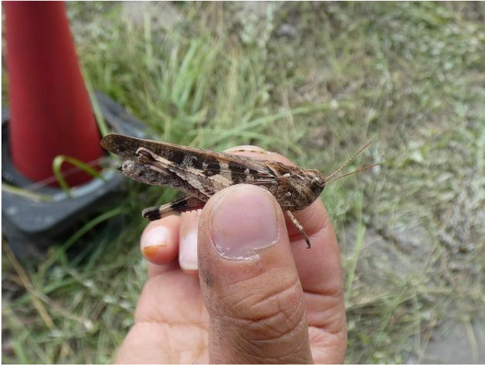
クルマバッタモドキ