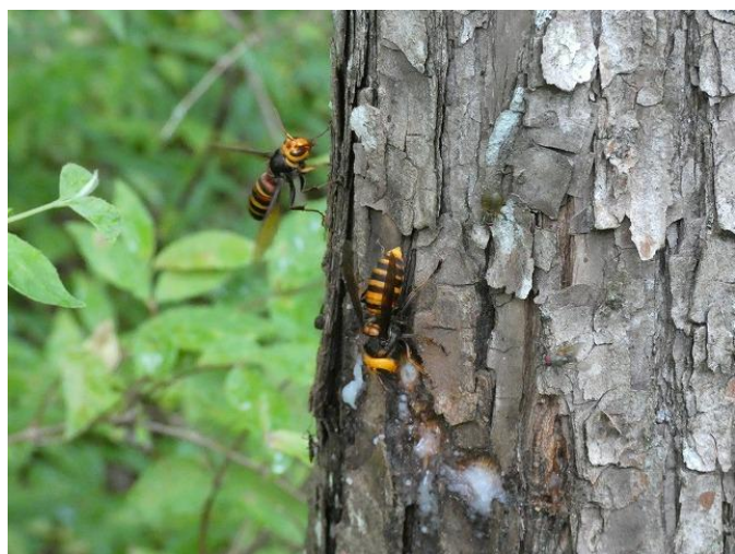
オオスズメバチとヒメスズメバチ