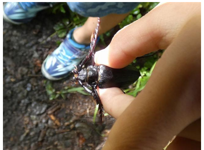
ノコギリカミキリ