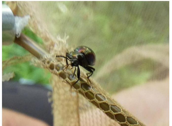
ニジゴミムシダマシの一種