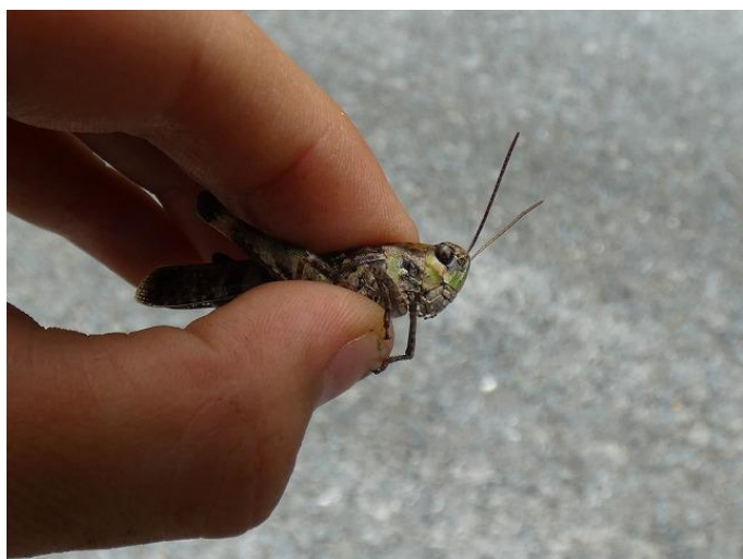
クルマバッタモドキ