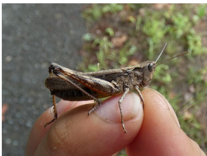
ヒロバネヒナバッタ