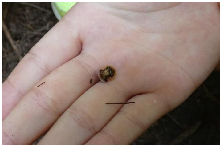
イチモンジカメコノハムシ