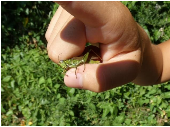
ハネナガフキバツタ