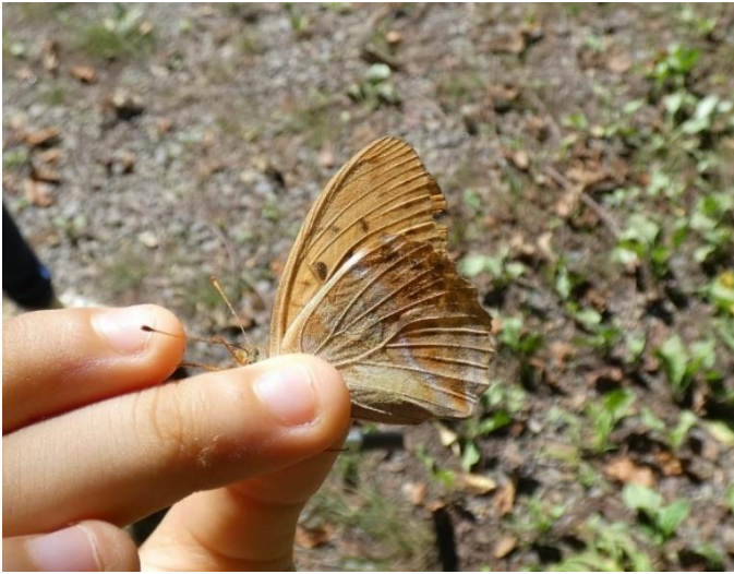
メスグロヒョウモン