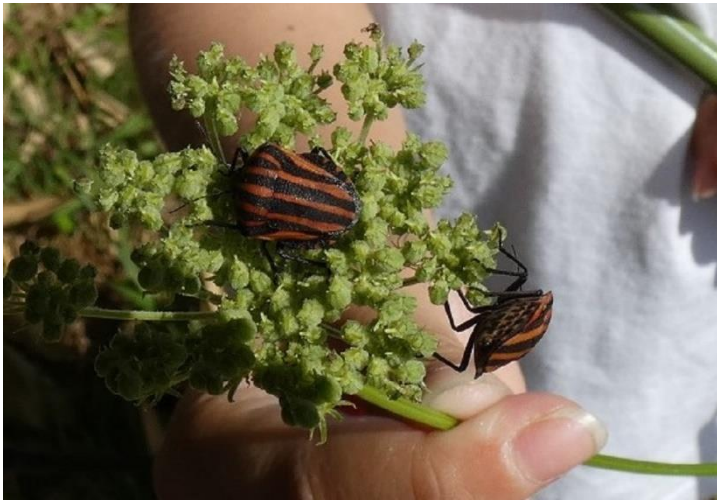
アカスジカメムシ