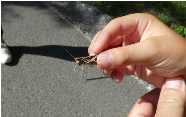
ヒロバネヒナバツタ