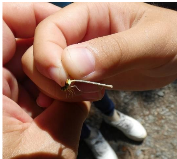
イトトンボの一種