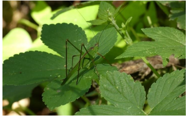
アシグロツユムシ