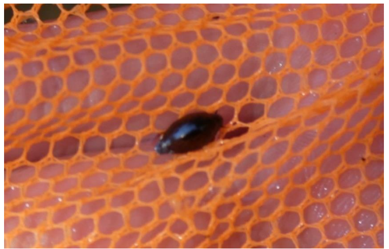
ミズスマシの一種