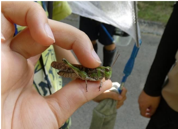
クルマバッタモドキ（緑色型）

他にも、トノサマバッタやハネナガフキバッタ、ヒメクサキリやエンマコオロギが見られました。