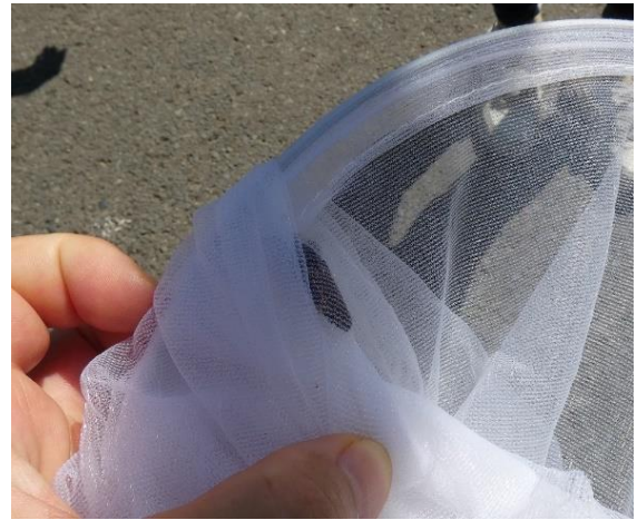
エントツドロバチ?