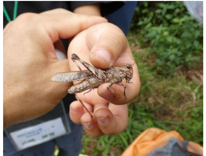
クルマバッタモドキ（褐色型）