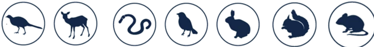
とり シカ ハビ ことり ノウサギ リス ネズミ