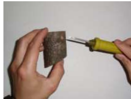
②電動ドリルやキリで穴をあける