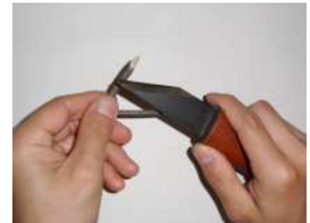
③接続部分をはさみやナイフで尖らせる