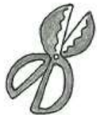
せんていよう 剪定用ハサミ