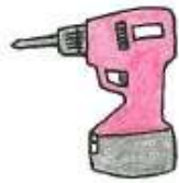
でんどう 電動ドリル