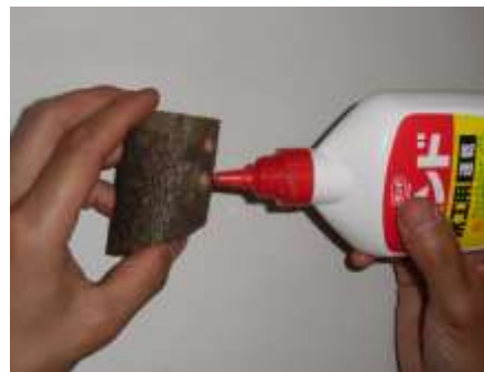
④穴にボンドを詰めて足や角を取り付ける