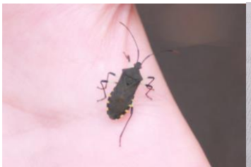
キバラヘリカメムシ