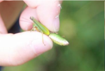
ミヤマフキバツタ