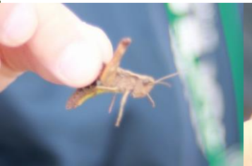
ヒロバネヒナバツタ