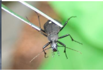
コクロナガオサムシ