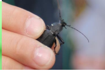
コクロナガオサムシ