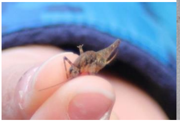
マダラカマドウマ (幼)