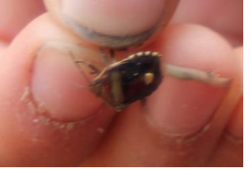
ツマジロカメムシ