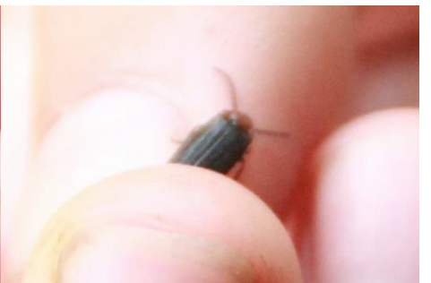
ムネクリイロボタル