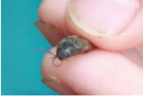
エダヒゲナガハナノミ