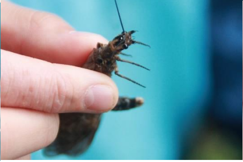
クロスジヘビトンボ