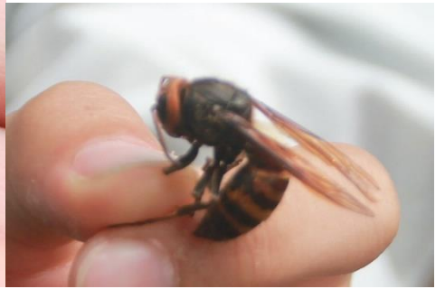
なんと！素手でコガタスズメバチを！ と思ったらもう動かなくなっていました・・・