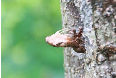
ニイニイゼミの羽化