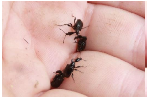
エゴツルクビオトシブミ