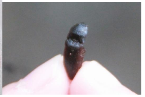
クロツヤクシコメツキ