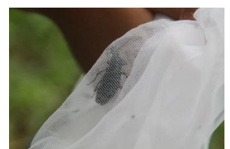
クロナガオサムシ