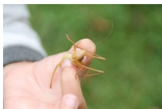
ヒメクサキリ (褐色型)