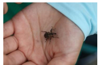
ガロアナアキゾウムシ