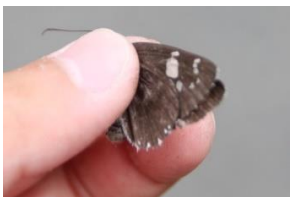
ダイミョウセセリ