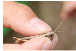
ヒロバネヒナバッタ