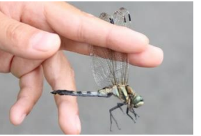
オオシオカラトンボ