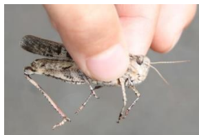
クルマバッタモドキ