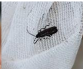
カクムネベニボタル