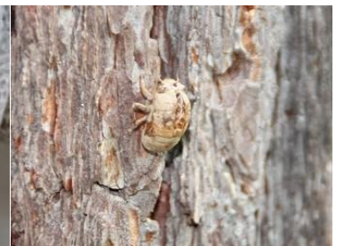
ニイニイゼミ抜殻