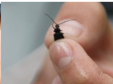
エダヒゲナガハナノミ