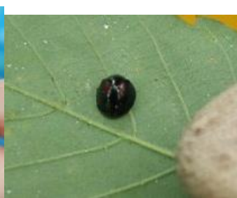
アカホシテントウ