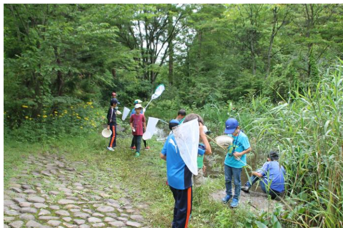
コオイムシとれね〜…

ムシなど夏の昆虫もまだまだ見られ 今回もオニヤンマやスジクワガタなど をゲットした人もいましたよ！