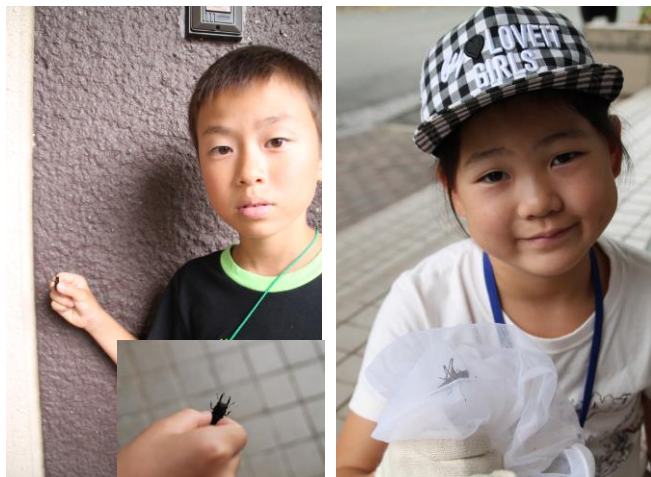
玄関出たら2分でゲット！

ろそろ変わり始めていきます。園内ではチッチゼミが鳴きはじめましたので、そろそろ秋が近づいてきたなという感じ です。とはいえ、アブラゼミやクワガタ