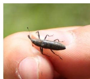
ナガカツオゾウムシ