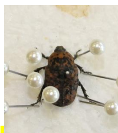
アカマダラコガネ