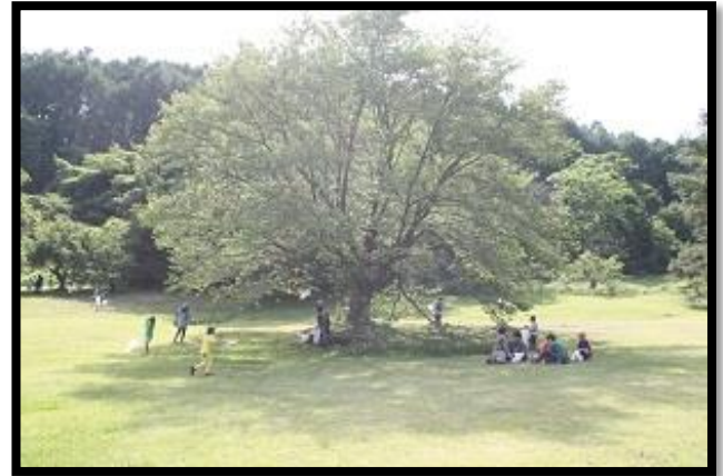
わんぱく広場での採集風景