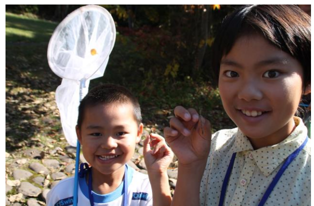
きょうだいなかよ 姉 弟 仲 良 く ア オ イ ト ト ン ボ ゲ ッ ト ！