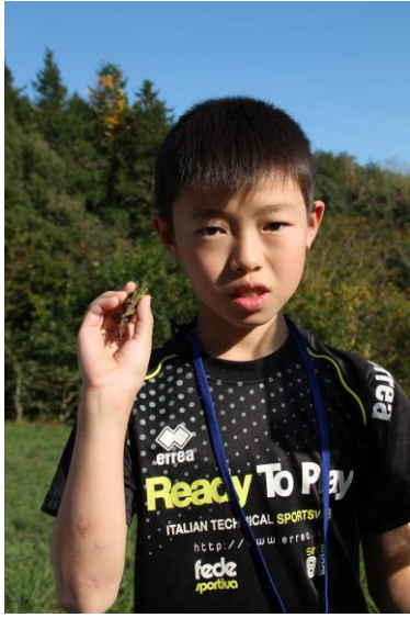
いたぜ！トノサマバタ

さいしゅうびより いちにち けっきょく ぜんぶ しゅ じつ とても採集日和の一日でしたが、結局採集できたのは全部で32種と、実 みな くせん かん は皆さんちょっと苦戦した感じとなりました。