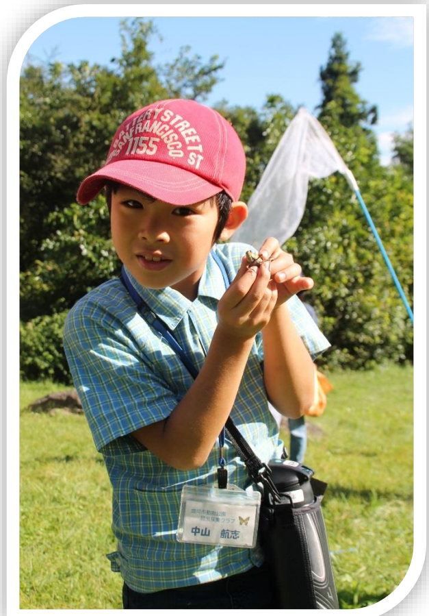
トノサマバッタだよー