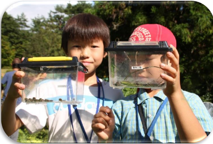
仲良くコアオハナムグリゲット!!