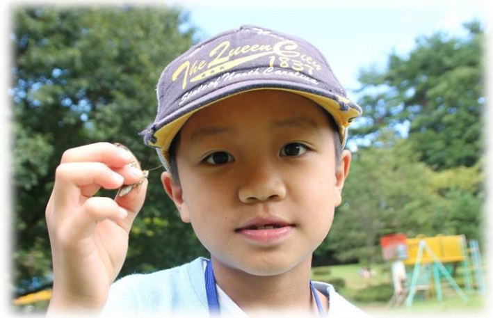
ウラギンヒョウモンとったよ