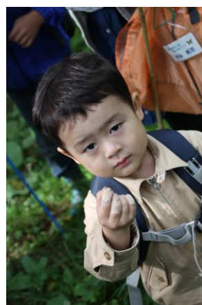
カメムシとったよ。