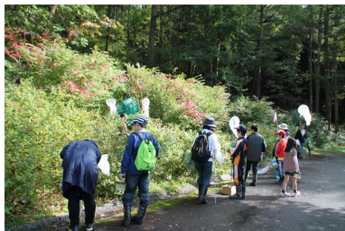
トビムシ付きのキノコ探索中。

エビガトビムシ。1mmもない大きさです。顕微鏡でのぞいてみたところ、グレー色のエビガトビムシという種類のようでした。