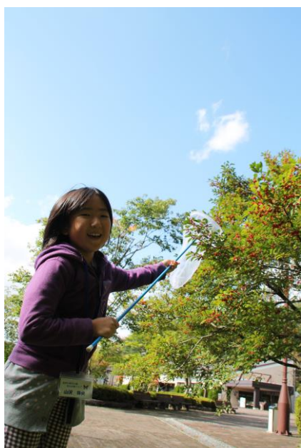
青空の中気持ちよく採集！