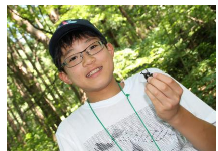
カブトムシ採ったよーん