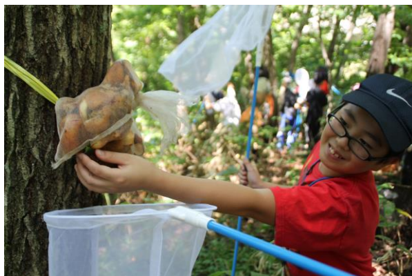
リンゴトラップでの採集風景

今回の例会は「リンゴトラップの観察」で、前回の例会で設置したリンゴトラップに集まった「樹液に集まる虫」を採集しました。トラップにはカブトムシやアオカナブン・スジクワガタなどが来ていて、みんなで仲良く分けあいました。