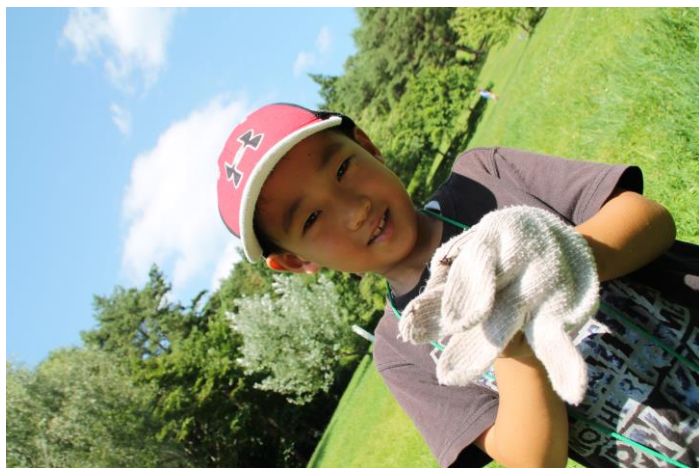
ウスバカミキリとりました