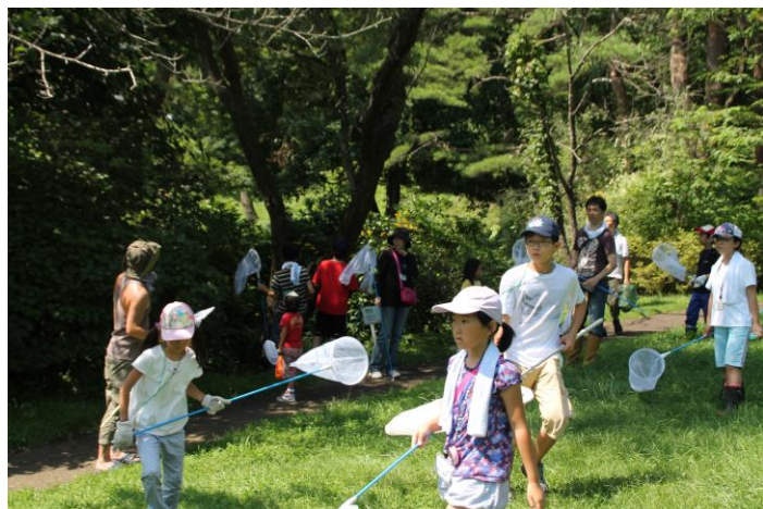
芝生広場での採集風景

その後は子供動物園芝生広場へ移動して採集しました。移動途中のクルミの葉にはコフキコガネがたくさんついていたので木をゆすって落として採集し、芝生広場のヤナギの木では群がってついてきたウスバカミキリを採集しました。またオニヤンマが最盛期のように、お父さん方の協力のもとで欲しい人全員にいきわたりました。