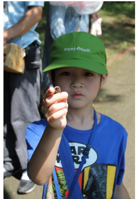
コフキコガネ・ゲット

採集日時 2013年8月10日(土) 13:15~14:00 採集場所 四季の森・子供動物園芝生広場 天気 晴れ 気温 31.5℃