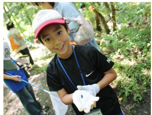
ぼくのはオオゾウムシだよ