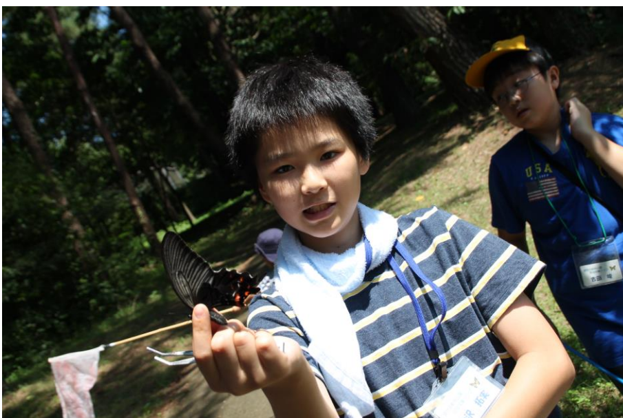
せっかく採ったのに、三角紙に入れるときに逃げられたクロアゲハ