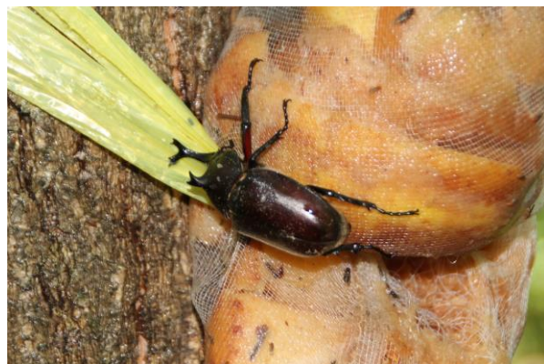
カブトムシはこの1匹だけでした

その後は子供動物園芝生広場へ移動して採集しました。移動途中のクルミの葉にはコフキコガネがたくさんついていたので木をゆすって落として採集し、芝生広場のヤナギの木では群がってついてきたウスバカミキリを採集しました。またオニヤンマが最盛期のように、お父さん方の協力のもとで欲しい人全員にいきわたりました。