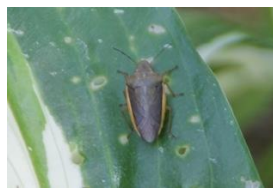
シロヘリカメムシ