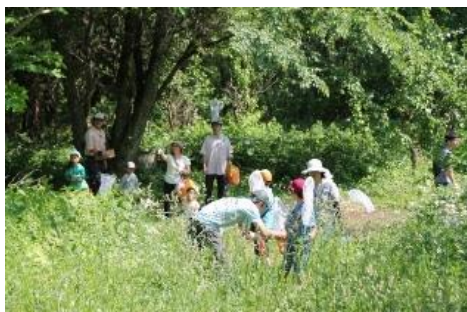
わんぱく広場の採集風景

わんぱく広場に行く途中では、ウスバシロチョウが数多く飛び交いほぼ全員が採集できました。このチョウはふわふわとあまり羽ばたかないで飛ぶので採集にはもってこいでした。ただ、メスが採れなかったため、最初に説明したオスが他のオスに交尾させないためにメスの腹部の先端につける交尾付属物の観察ができなかったのが残念でした。