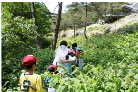
四季の森での採集風景

四季の森では、イタドリの葉についたヒゲナガオトシブミやイタドリハムシ、散策路の路上にいたニワハンミョウなどを採集しました。