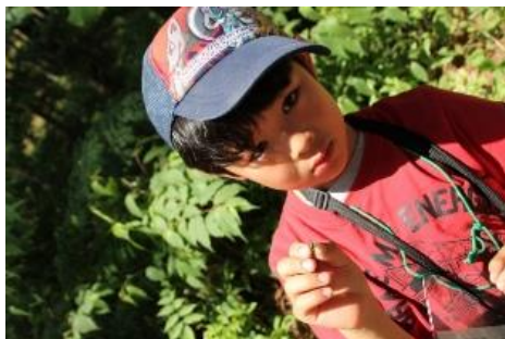
ニワハンミョウ採りました！ なにがはいっているのかなー？