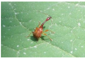
ヒゲナガオトシブミ

ウスバシロチョウ・ベニシジミ・ミヤマセセリ・コチャバナセセリ・スジグロシロチョウ・ヒメウラナミジャノメ・クロヒカゲ・トラガ・シロモンハマキ・シャクガの一種