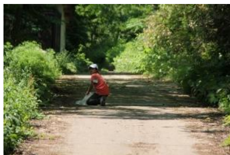
ウ・ス・バ・シ・ロ・チ・ョ・ウ